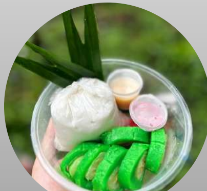
ES PISANG HIJAU